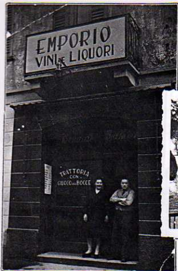
L'ingresso della Trattoria di Via Belfiore.