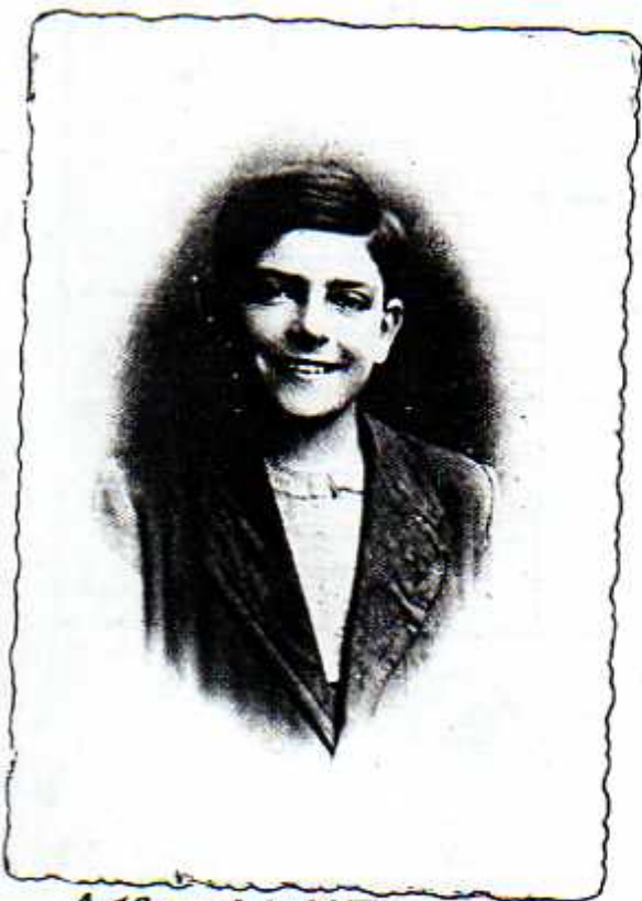
A 10 anni, in V Elementare, pronto per gli esami...