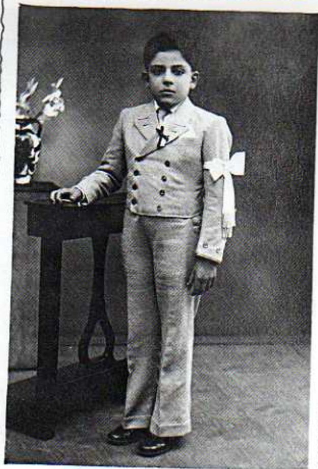
Il giorno della sua Prima Comunione