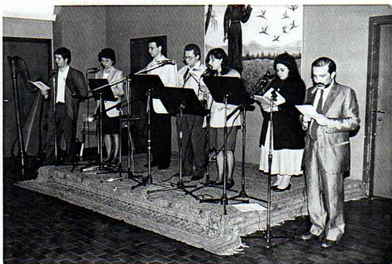
Alcuni dei bravissimi lettori e fini dicitori che impreziosiscono la Parrocchia