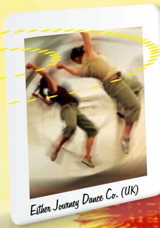
Esther Journey Dance Co. (UK)