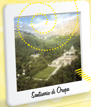
Santuario di Oropa