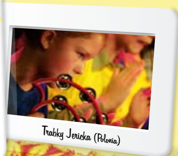
Trabky Jericka (Polonia)