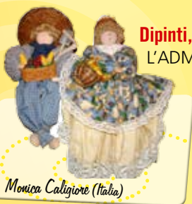
Monica Caligiore (Italia)