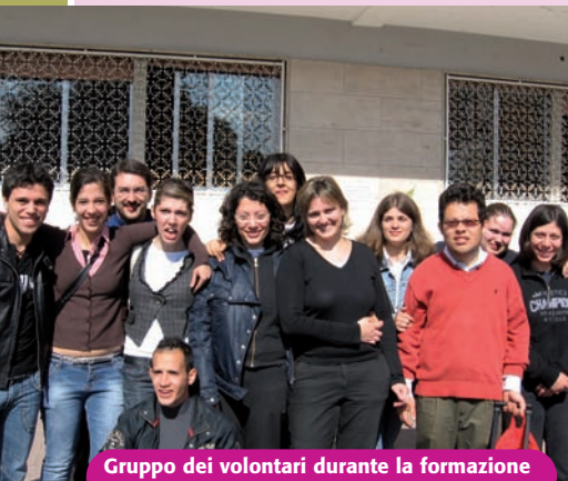
Gruppo dei volontari durante la formazione di metà servizio (Napoli)